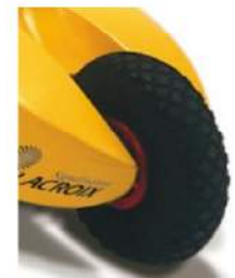
Roue pleine anti-crevaison

• Système ADP, (Anti-Décharge Profonde) : prolonge la durée de vie des batteries