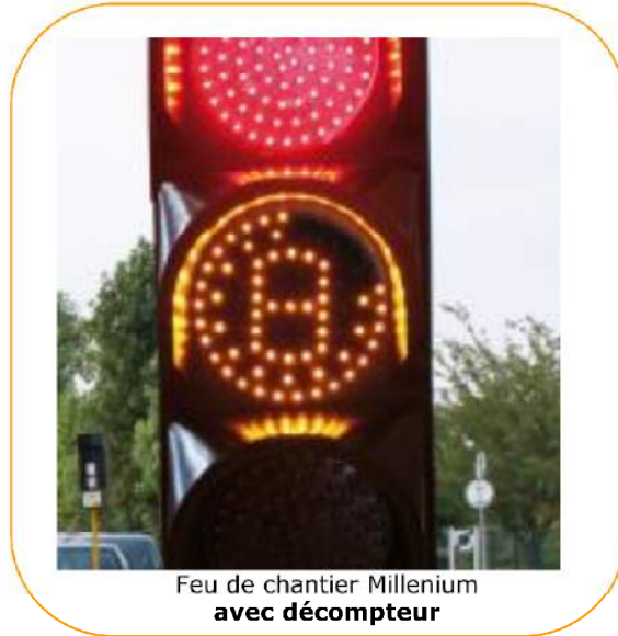
Feu de chantier Millenium avec décompteur